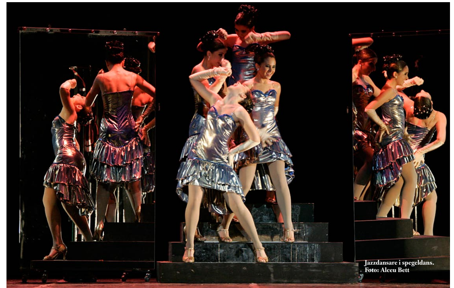
Jazzdansare i spegeldans.

Se vidare Festival de Dança Joinville www.festivaldedanca.com.br samt Passo de Arte, Indaiatuba www.passodearte.com.br