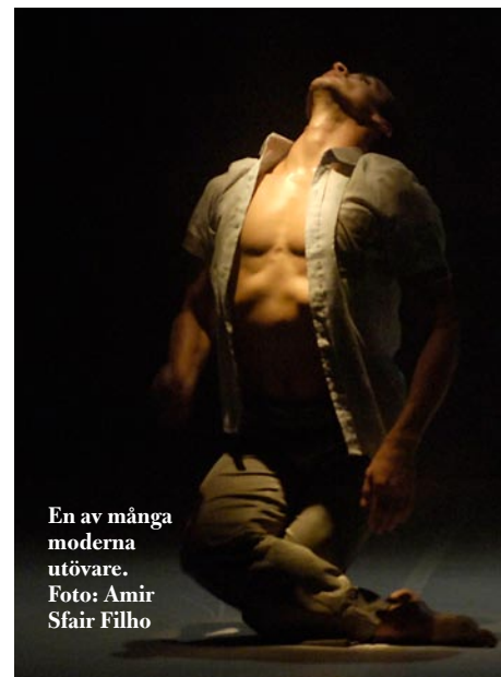
En av många moderna utövare.

Festivalen har utvecklats till ett pedagogisk projekt som även mobiliserar föräldrar och barn i Joinvilles skolor. Det pågick föreställningar på utomhusscener runtom på gator, torg och shoppingcenter. Till och med sjukhus och fabriker invaderades av