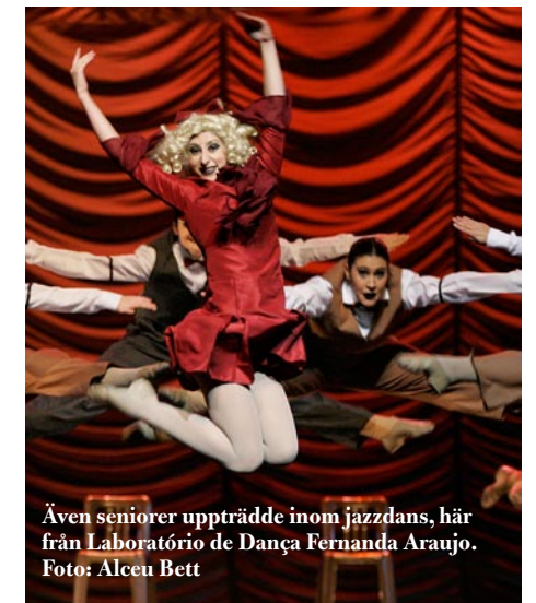
Även seniorer uppträdde inom jazzdans, här från Laboratório de Dança Fernanda Araujo.